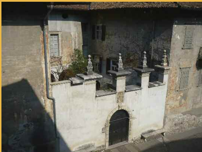
"Il lato ovest di palazzo Priami-Madernini-Marzani foto R.Potrich marzo 2011"

Giorgio ebbe diversi proprietari, nel 1995 la parte Ovest è ritornata Marzani e per l'occasione alcune stanze del palazzo saranno visitabili per volontà di Antonia Marzani.